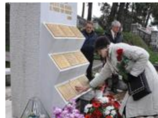
• Tužilaštvo čuti o mučenicima iz Lore