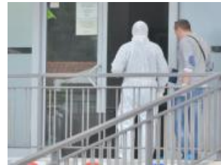
• Ubijen pred deset svjedoka