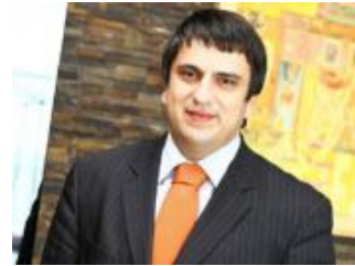
• Podržao DPS pa dobio stan od 98 kvadrata