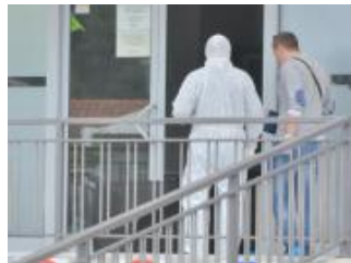
• Ubijen pred deset svjedoka