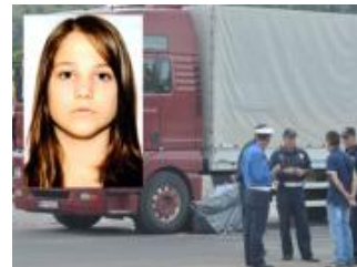
• Djevojčica poginula na putu do škole