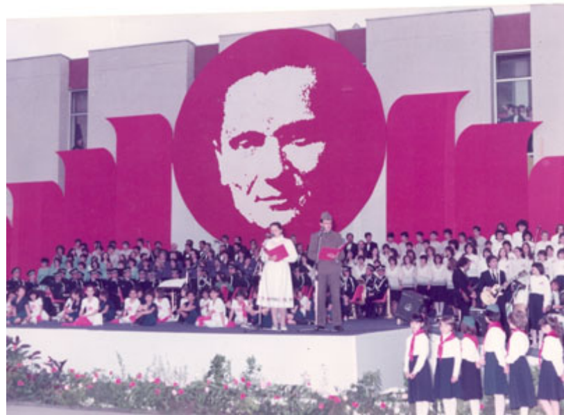
Obilježavanje Dana mladosti (arhiva)