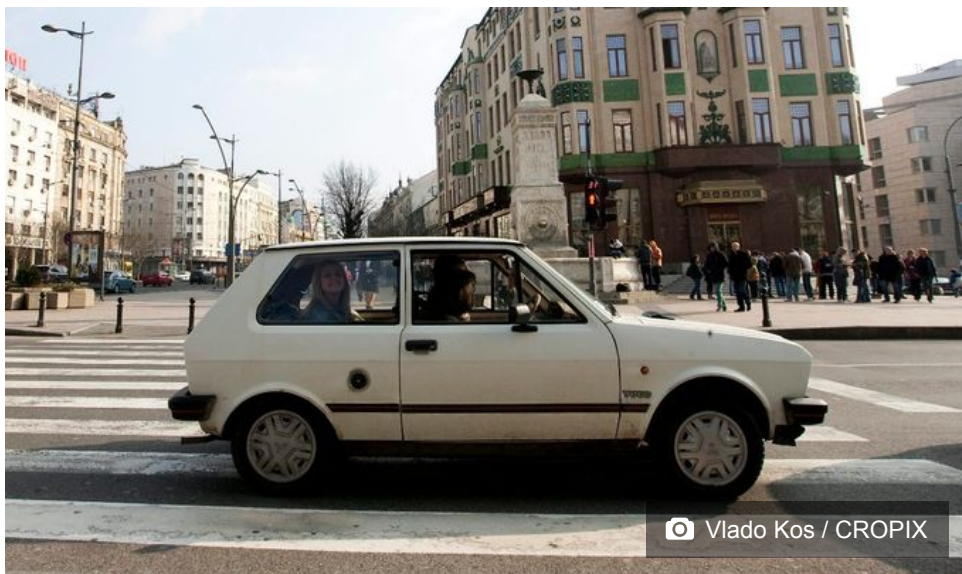
Hotel Moskva u centru Beograda

AUTOR: Hina OBJAVLJENO: 22.08.2018. u 11:41