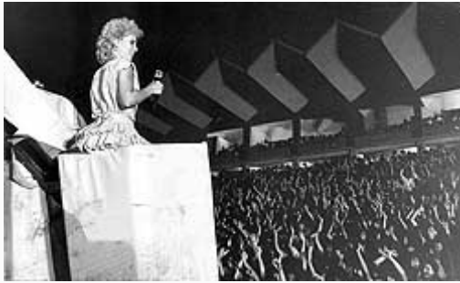
...na koncertu u Temišvaru

Ispostavlja se da je reakcija publike bila sasvim suprotna od one koju je Minimaks hteo da postigne, jer je njegovo ismevanje zapravo bilo najbolja reklama za mladu pevačicu. Minimaks shvata da je pravo vreme da je dovede u emisiju. Posle toga, i zvanično, zvezda je rođena, a "brenomanija" uzima sve više maha.