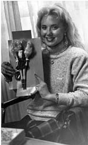
...sa "barbikom" sa svojim likom

Ispostavlja se da je reakcija publike bila sasvim suprotna od one koju je Minimaks hteo da postigne, jer je njegovo ismevanje zapravo bilo najbolja reklama za mladu pevačicu. Minimaks shvata da je pravo vreme da je dovede u emisiju. Posle toga, i zvanično, zvezda je rođena, a "brenomanija" uzima sve više maha.