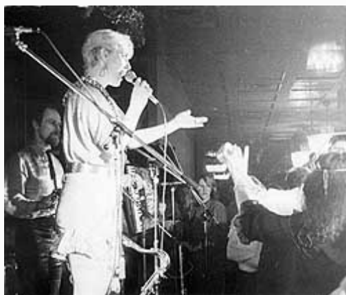
LEPA BRENA: Prvi nastupi;...

Da je Brena neosporno harizmatična ličnost potvrđuje Stanko Crnobrnja, režiser poslednja dva nastavka filma Hajde da se volimo , opisujući nekoliko scena kojima je bio svedok: "Eksterijer. Noć. London. Prilaz kineskoj četvrti. Dok hoda ulicom punom noćnih klubova, ka visokoj, plavoj devojci, u tankim, dugačkim štiklama i ultrakratkoj suknji, iz klubova se zaleću muškarci, izjavljuju ljubav, mašu, zvižde. Namontirani transseksualci sa uzbuđenjem uzvikuju: 'That's the way to go, girl!' Enterijer. Noć. Madrid. Flamenko bar. Profesionalne igračice flamenka u publici primećuju lepu, plavu devojkicu. Insistiraju da im se pridruži na sceni. Devojka prvi put u životu pleše flamenko i to na štiklama od dvanaest centimetara. Publika i profi igračice vrište od sreće."